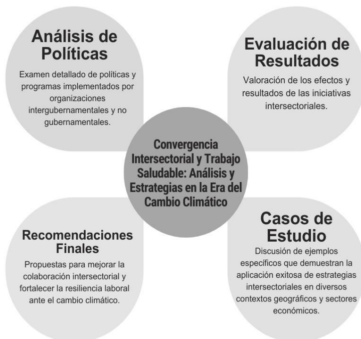
Figura 1. Convergencia Intersectorial y Trabajo Saludable.

Nota: El diagrama ilustra los componentes clave de la convergencia intersectorial y estrategias de trabajo saludable en la era del cambio climático, incluye análisis de políticas, evaluación de resultados, casos de estudio y recomendaciones finales.