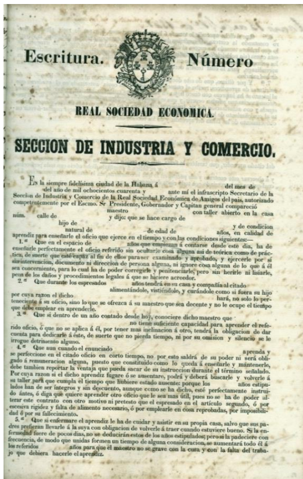
Figura 1. Modelo de escritura de aprendizaje del ramo de enseñanza pública en artes y oficios de La Habana.

ordenada por el gobierno logró que en julio de 1843 los talleres de extranjeros quedasen bajo la supervisión del ramo de aprendizaje (Memorias de la Sociedad Económica de La Habana, 1843, Tomo XVI, pp. 7-9, 154).