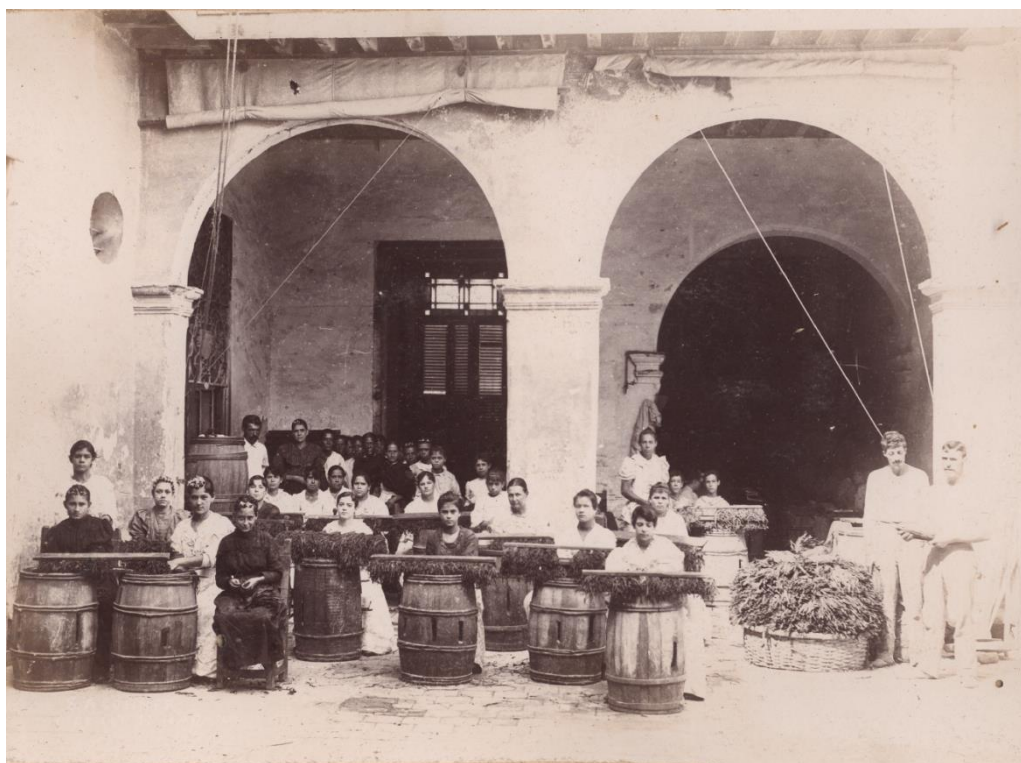
Figura 4. Foto de mujeres despalillando hojas de tabaco. Década de 1880, La Habana.