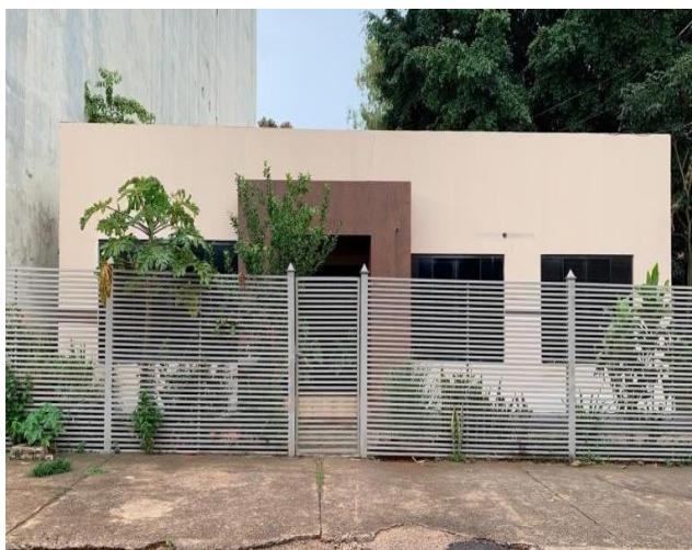
Figura 4. Fachada de la Sede de la Supervisión Educativa de Saltos del Guairá sin presencia de simbolismo religioso.

En la figura 3, si bien, la institución pública en su edificación no presenta símbolos o iconografías religiosas, se observó, en la motocicleta, que forma parte del patrimonio público del estado al servicio de la sociedad, un adhesivo con la indicación de Salmo 23:4, refiriéndose a un pasaje bíblico.