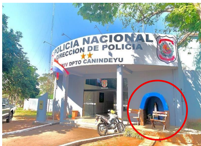
Figura 1. Gruta de la Virgen de Caacupé en Dirección de Policía.

Las siguientes imágenes revelan los símbolos e iconografías religiosas visibles en las instituciones públicas de Saltos del Guairá. La figura 1 muestra una gruta dedicada a la Virgen de Caacupé en la Dirección de Policía.