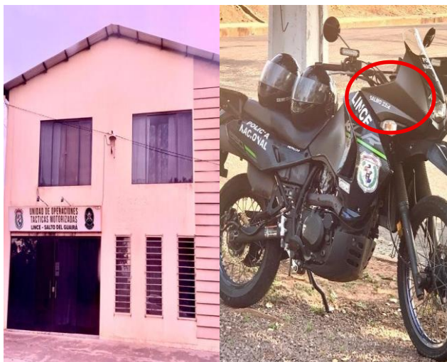
Figura 3. Entrada a la Unidad Lince y motocicleta (móvil oficial de la unidad) con calcomanía de Salmo 23:4.

la Unidad LINCE con inscripciones bíblicas; y la figura 4 corresponde a la Supervisión Educativa, donde no se identificaron símbolos religiosos.