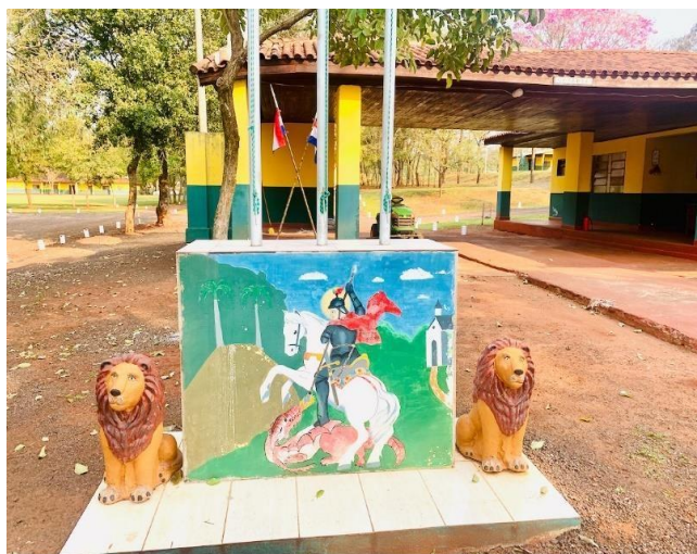
Figura 2. Mural de San Jorge en Destacamento Militar: Representación del santo patrono de las fuerzas armadas.

La figura 2 exhibe un mural de San Jorge en el Destacamento Militar.