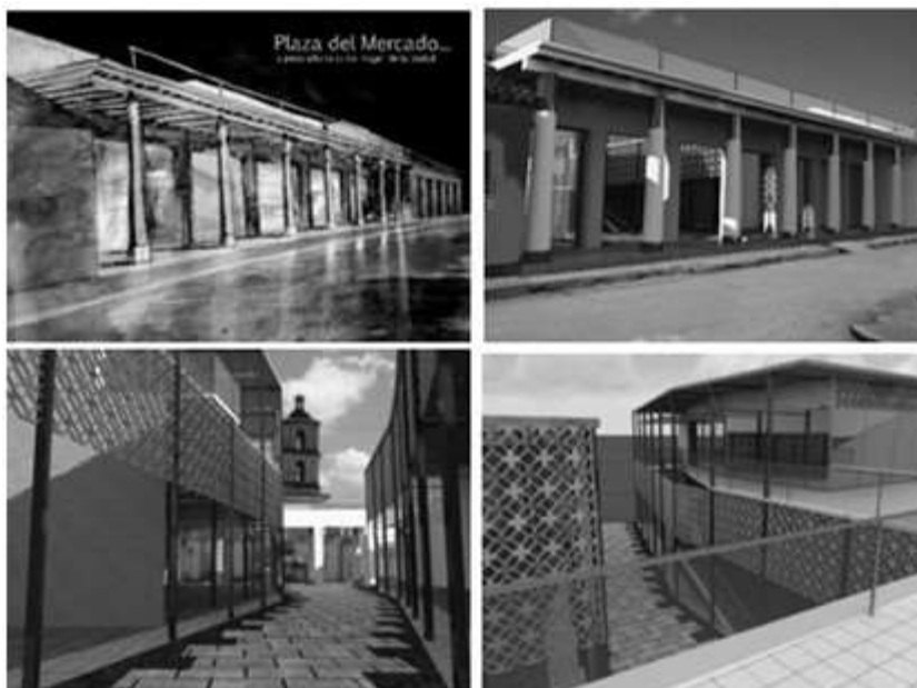
Figura 3. Propuesta. Imaginarios exteriores de la galería de acceso e interiores del edificio y la callejuela. Primer Premio.

Las menciones fueron para: Infotur y conjunto de viviendas, por su integración conceptual, por el manejo adecuado de las proporciones, por recrear de forma acertada los volúmenes, por la búsqueda de soluciones y el manejo de los espacios., el proyecto del Sport Club El Güije que se le reconoce su contemporaneidad en la propuesta e integración con el contexto construido; asimismo se destaca el buen manejo de los códigos arquitectónicos y la factura del dibujo y la expresión en cada etapa del proceso y por último, recibió también mención el Ayuntamiento Municipal, por la transparencia y accesibilidad lograda en la propuesta, además del respeto a las líneas y alturas en correspondencia con el entorno.