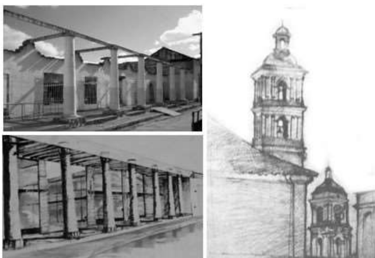
Figura 2. Plaza del Mercado. Estado actual y solución inicial. Primer Premio.

El ocupante del Primer Premio fue, el proyecto Plaza del Mercado, en él, se incorporó transparencia en la solución, logró visuales importantes en un contexto comprometido, y sobre todo se destacó la factura no solo de la representación final sino el dibujo en cada parte del proceso (Figuras 2 y 3).